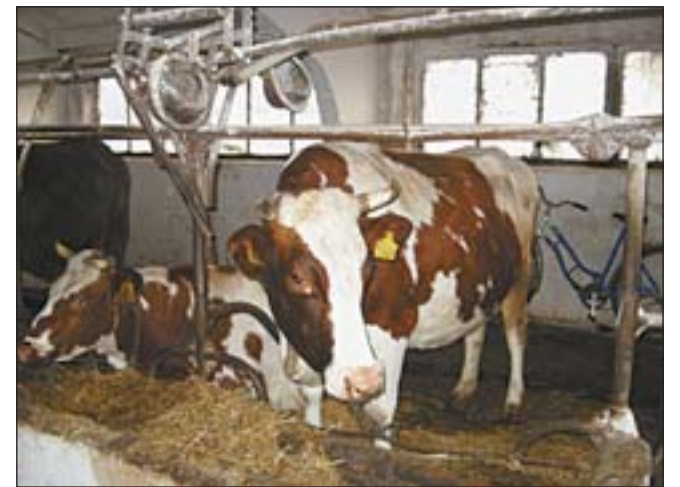
Мясомолочное будущее Украины растет здесь

Фактически предприятие во всеоружии готово встретить надвигающийся на Украину кризис — такое впечатление от увиденного и услышанного.