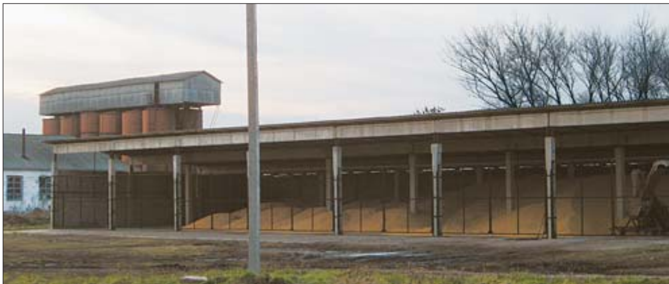
Урожай цього года не вместился даже в огромные зернохранилища

Окрім того, згідно з прогнозом, зниження цін на пшеницю і високі втрати на виробництво призведуть до скорочення посівних площ в основних країнах-виробниках, частина сільгоспвиробників, розчарованих доходами від урожаю 2008 р., переключиться на вирощування інших культур. Як прогноують експерти МРЗ, загальна площа посівів зменшиться на 1,6% — до 221,7 млн. га.