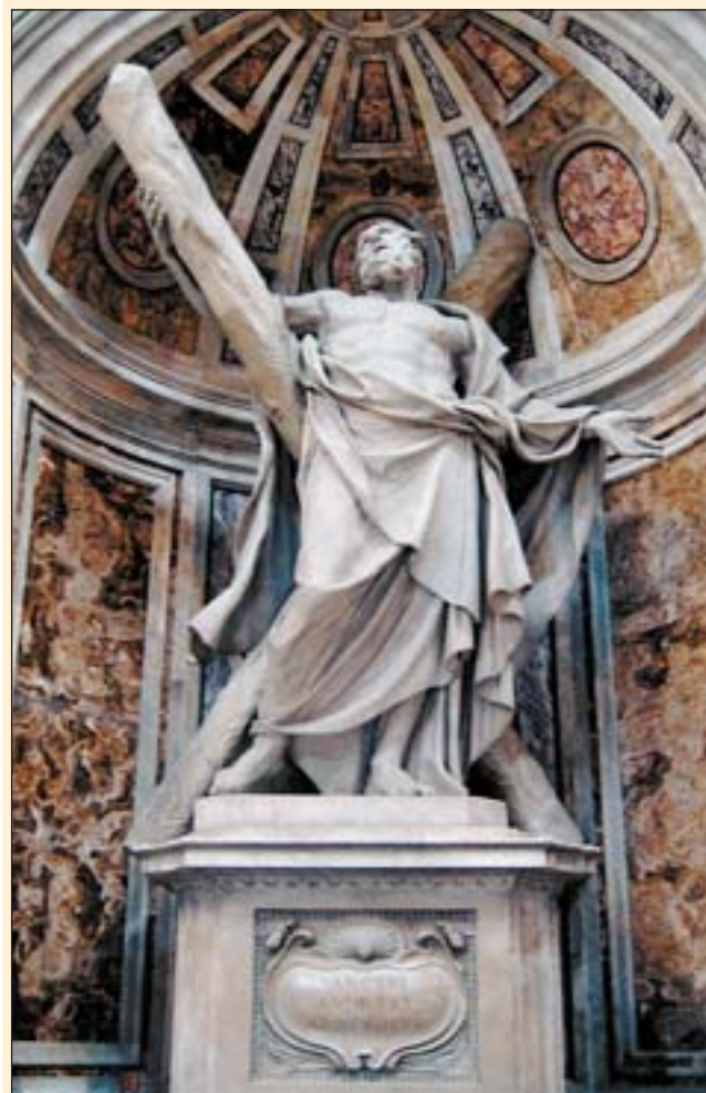
Рака апостола Андрія Первозванного у базиліці Святого Петра в Римі