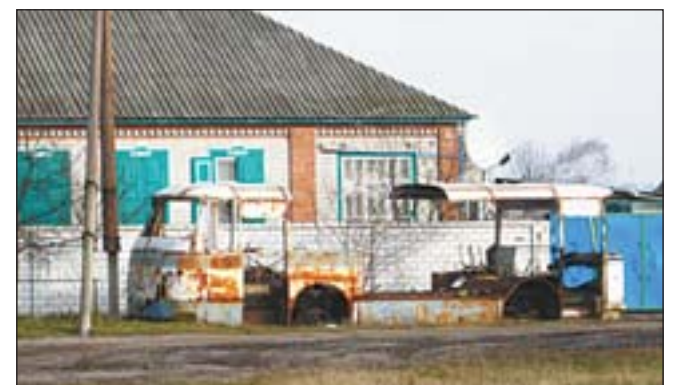
Остановка — село Шелудьковка