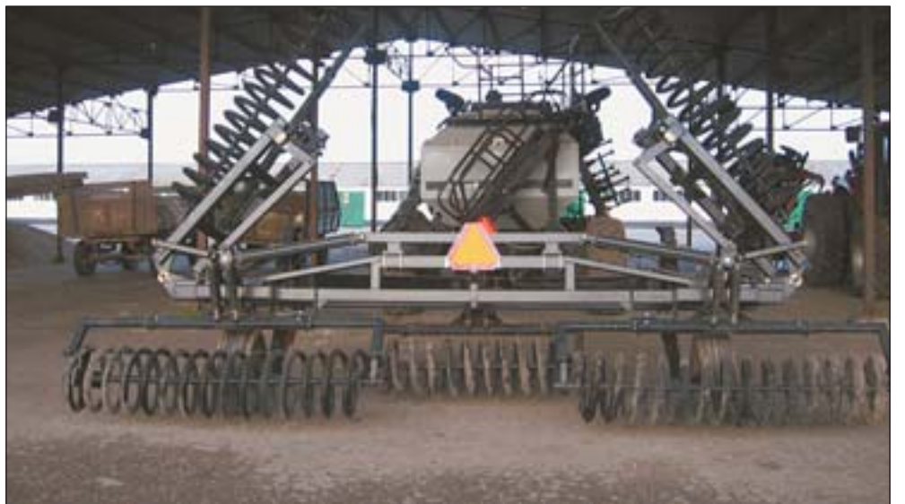
Это не декорации для ужастиков