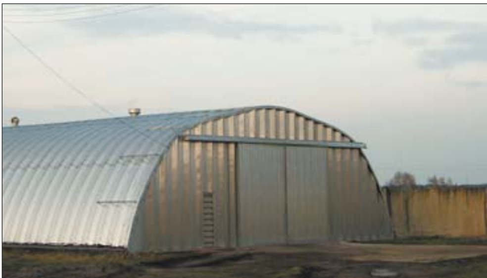
Здесь продавать зерно никто не спешит — есть где хранить