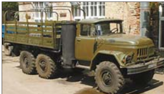
Газогенератор у дії