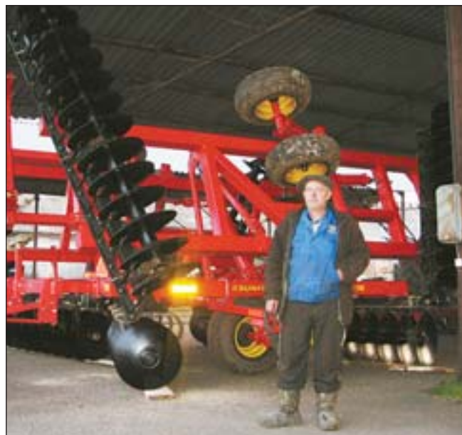
В ожидании весенней посевной