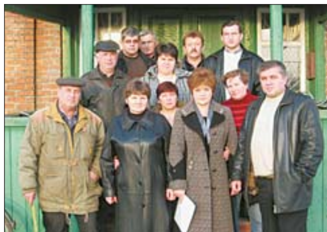
Коллектив агрофирмы им. Гагарина