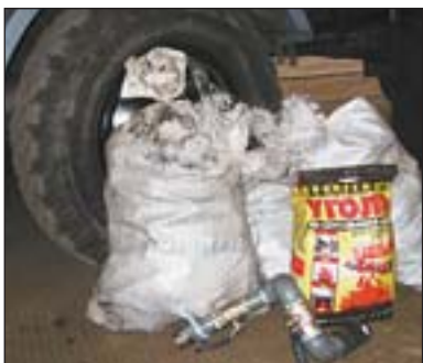
Альтернатива бензину і солярці

Довідка. Інститут місцевих видів палива: Київ, вул. Булаховського, 2, тел./факс: (044)502-4205.