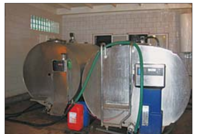
Здесь «молоко коровье» превращается в «молоко на продажу»