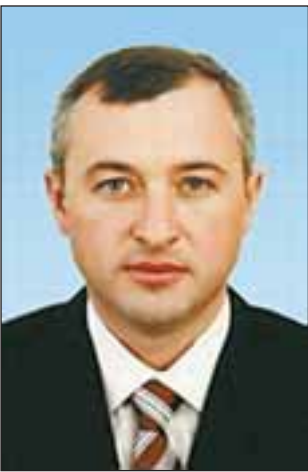
Ігор КАЛІТНИК, голова Комітету Верховної Ради з питань боротьби з організованою злочинністю і корупцією

Права і свободи людини та їх гарантії визначають зміст і спрямованість діяльності держави.