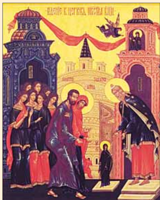
Ікона «Введення у храм Божої Матері»