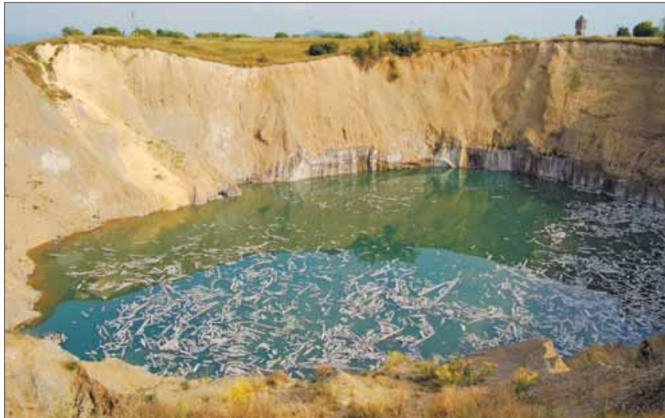
Зони карстових провалів безперервно розростаються

но не зробили. Сьогодні історія може повторитися.