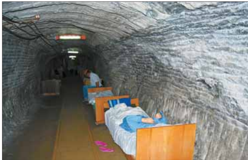
У новому підземному відділенні ще немає палат

Розповідач хотів показати, якими дурними й небезпечними можуть бути люди перейнявшись страхом. А я подумав: як же їм потрібна ця підземна лікарня, якщо вони готові проходити разом із дітьми через усе це!