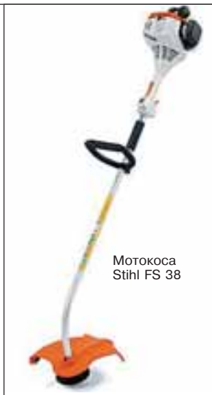
Мотокоса Stihl FS 38

Франковск, ул. Высочана, 18, тел. 8-03422-23353) предлагает навесную косилку КН-1,1, с которой работает трактор ТМК-07.