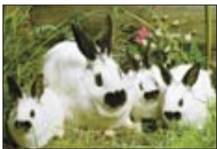
Будь ласка, читайте на стор. 5