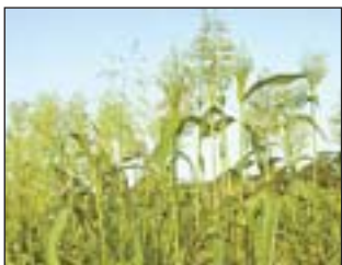
Будь ласка, читайте на стор. 7