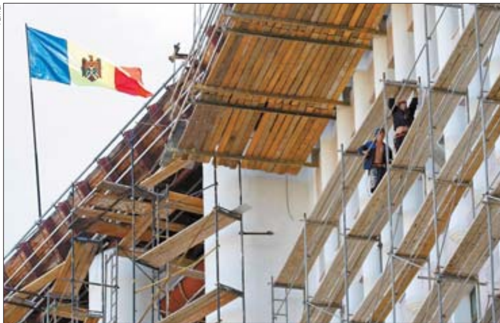
Після квітневих заворушень будинок парламенту довелося ремонтувати