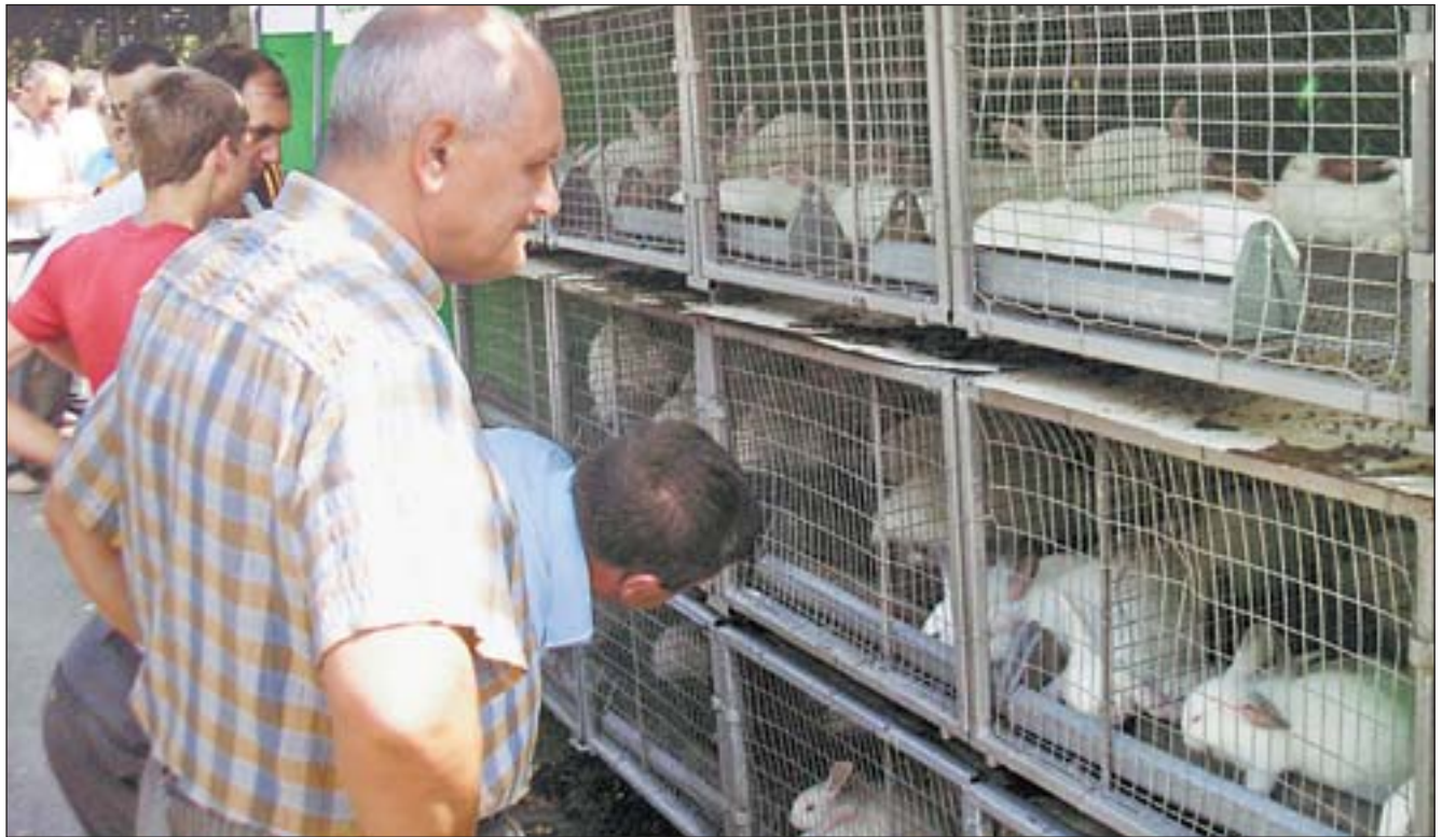
ФОТО З АРХІВУ - 2009

Чи знаєте ви, що у світі існують правильні «еко-кролики», нещасні «ретро-кролики» і небезпечні «техно-кролики» — а між їхніми прихильниками точиться справжнісінька війна? Так, і в Україні теж — хоча ви, готовий ручитися, з вигляду тварини не визначите, до якої «партії» вона належить.