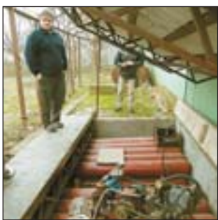
Будь ласка, читайте на стор. 8

Життя — на голці... «народного цілителя»