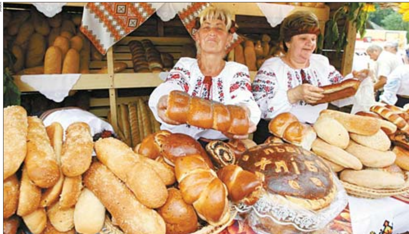
Вже четвертий рік поспіль у Львові відбувається "Свято хліба". В ньому беруть участь провідні хлібопекарські і кондитерські підприємства Львова, Львівської області і Польщі. Захід щодо відродження давніх традицій вшановування хліба передбачає проведення виставки-продажу хлібобулочної і кондитерської продукції, дегустацію виробів, концертні виступи художніх колективів, артистів і народні гуляння.

Прогноз подготовлен УкргМЦ 19 августа 2009 г.