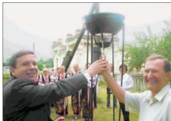
Свято в Соколівці — запалення символічного факела

Бобровицький район Чернігівської області буде повністю газифіковано до кінця року. Незгодавно тут проведено газовідводи від села Піски до п'яти сіл: Соколівки, Рокитного, Мочалища, Бірок та Красно-го. Причому зроблено це практично без участі держави.