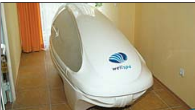
Спа-капсула. Хотите узнать, как она лечит? Приезжайте в отель