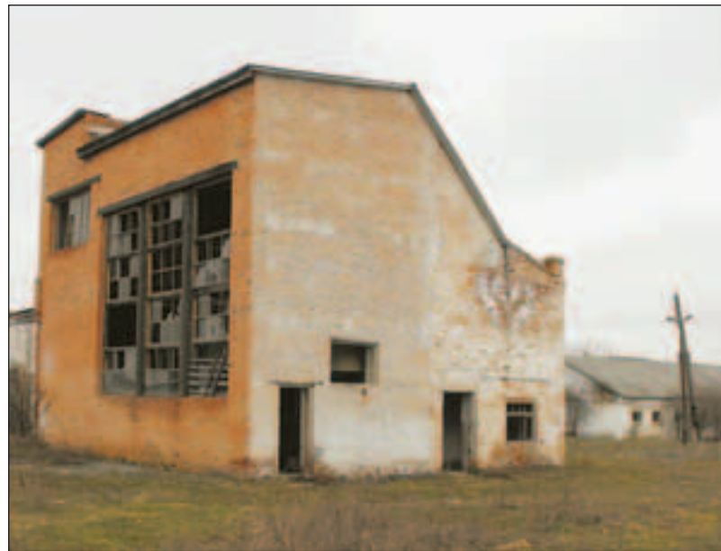
Кормоцех на «консервації»