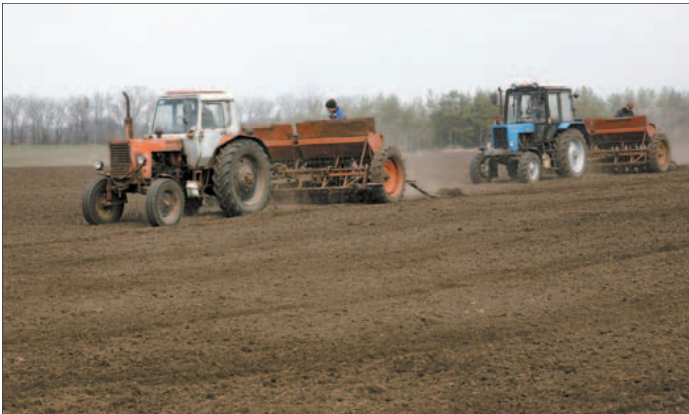
На полі СТОВ «Зоря», що у Миронівському районі Київської обл., сіють ярову пшеницю

За повідомленням Міністерства аграрної політики України, масова сівба ранніх ярових культур нинішнього сезону через несприятливі метеорологічні умови — затягну весну, недостатність сумарних плюсових температур — розпочалася пізніше. На 1 квітня близько 10 відсотків прогнозованих площ ранніх зернових і зернобобових культур вже засіяли господарства АР Крим, Дніпропетровської, Донецької, Запорізької, Одеської, Миколаївської та Херсонської областей. Наприкінці березня сівбу розпочали й господарства Київщини.