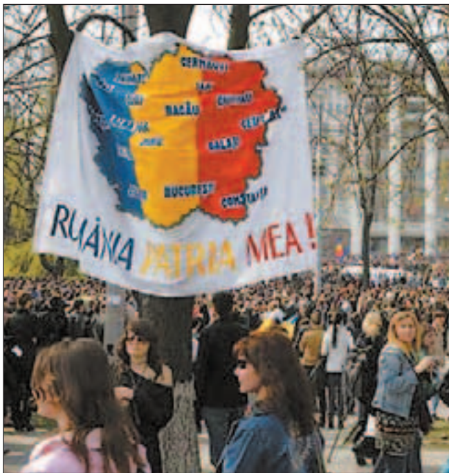
Они требуют присоединения Молдовы к Румынии

Трудящиеся Украины! Объединяйтесь в борьбе против Ющенко, националистов и олигархов!