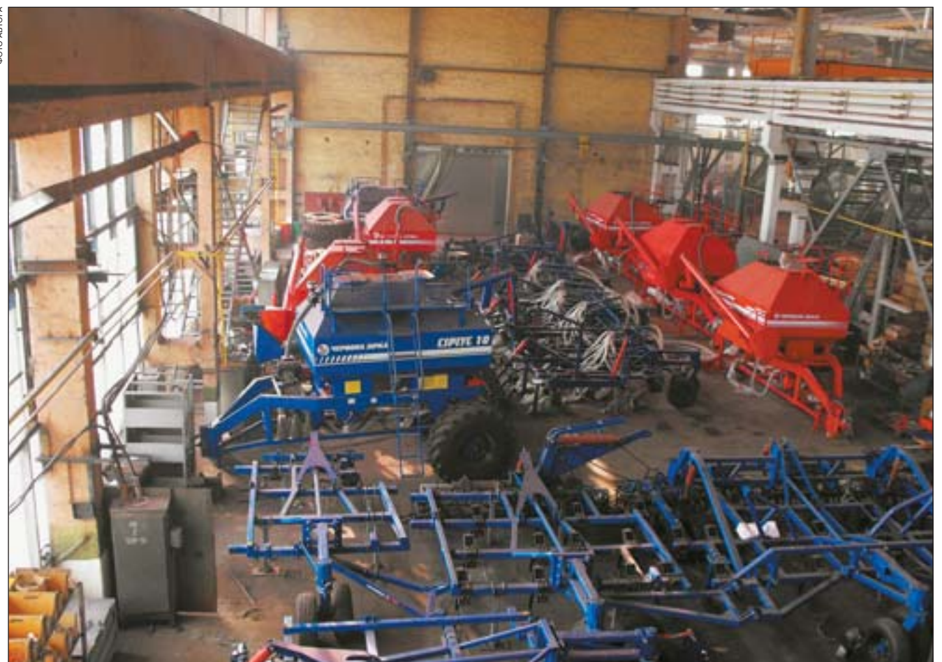
«Сіріус-10» в складальному цеху

Довідка. ЗАТ «Збутова компанія «Червона зірка»: Кіровоград, вул. Медведєва, 1. Тел.: 8 (0522) 35-61-16. www.chervonazirka.com