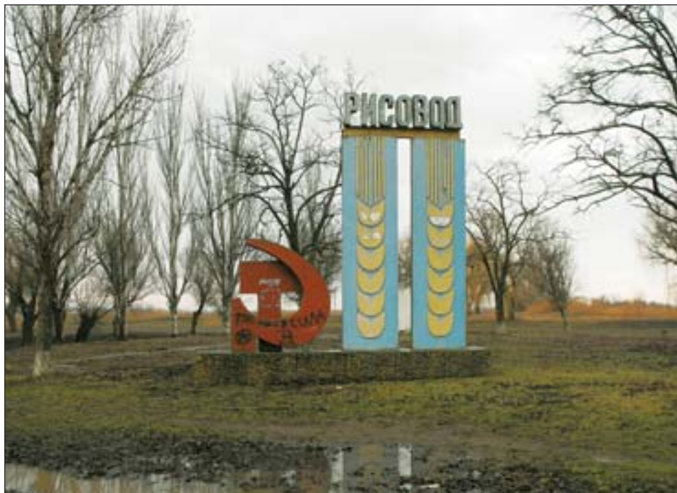
Все, що залишилось від радгоспу