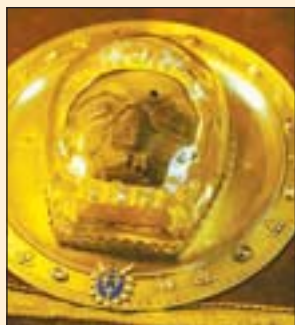
Честная глава святого пророка Иоанна Предтечи в кафедральном соборе Амьена

«Отмещущим бессмертие души, кончину века, суд будущий и