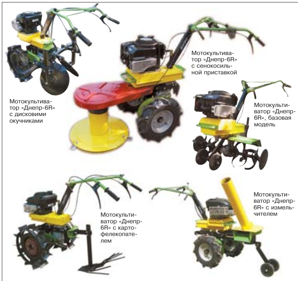
Мотокультиватор «Днепр-6R» с дисковыми орудиями