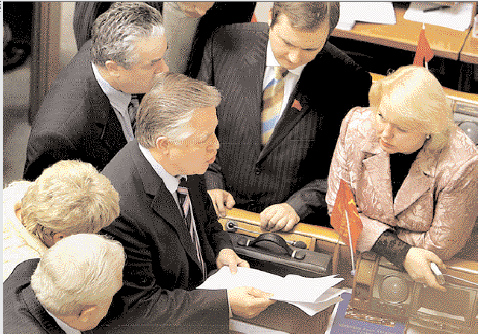
Коммунисты выступают за продление моратория на продажу земель сельскохозяйственного назначения